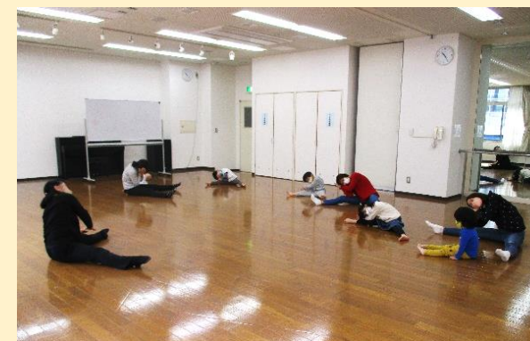
音楽に合わせてみんなでストレッチ♪

「コロナ禍で公園に足を運んでもなかなか話しかけづらい状況です。ママ達の情報共有、コミュニケーションの場として「クラブ・ミッフィー」で仲間づくりをしませんか？小さなお子さんにとっても人との関わりはとても大事です。ぜひ一緒に動きましょう！」