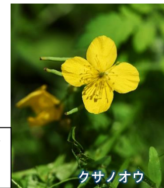
クサノオウ ♡広場初登場

大きく出ました草の王様、実はクサとは瘡の事、皮膚病によく効く薬の王様という意味。