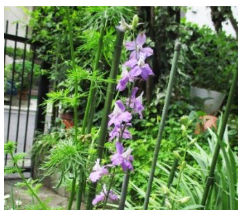
↑ ノースポール・ピオラ ← チドリソウ

紫色の花を咲かせているのはチドリソウ。5~6月に花を咲かせ、初夏の花壇を彩ります。花の形がチドリ（千鳥）の飛ぶ姿に似ていることから、その名前が付いたといわれています。そのほか、表紙に掲載したシャクナゲやノースポールやピオラなど、色鮮やかな花を見ることができました。