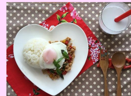
ガッパオごはん&タピオカココナッツミルク