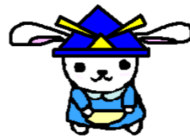
マスコットキャラクター 「うさのさん」 こどもの日バージョン

さのっこのみんなは、5月の長いおやすみにはお出かけするのかな？ ぼくはいつものように佐野センターで職員さんといっしょにおるすばんさ。もし、ぼくにおみやげを買ってきてくれるつもりなら、なんたっておいしいものがいいな～。待ってるよ～♪