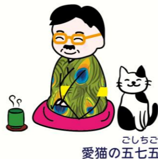
こしちこ 愛猫の五七五

「先生は子供の頃集めていたものとかあるのかにやー」「まあ人望とかかな」「面倒な人だにや...。それ以外は何かあるのかにやー」 「最近はおまり見かけんが小学生の頃カマキリの卵を集めてたことがあって、あれを見つけては家に持って帰ってきて虫かごにいれていたのじゃが、別に観察するわけでもなくある日突然大量のミニカマキリたちが誕生してるのを見つけて喜んでおったのじゃ」「あれは一個の卵から二、三百匹産まれるらしいにや」「虫カゴのフタの空気孔からごんごん逃げていって三日ぐらいで一匹もいなくなってしまうと満足してまた次の卵を探していたのじゃ」「飼育はしないのが先生らしいにや」「まあな」