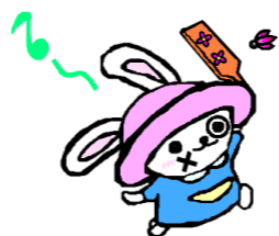
マスコットキャラクター「うさのさん」

さのっこのみんな。2026 年も、うさのさんをよろしくお願いします。さっそくぼくの新年の目標を発表するよ。毎月クイズにおうぼしてくれる子を倍に、いや、3 倍に増やすことさ！ 年始からセンターがまた始まったらみんなの新年の目標を聞かせてね～。