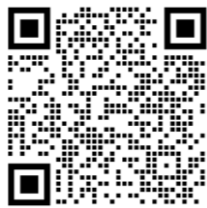
区HP システムリニューアルについて