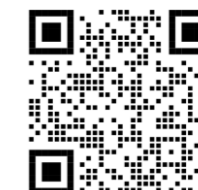
新チケット予約システム