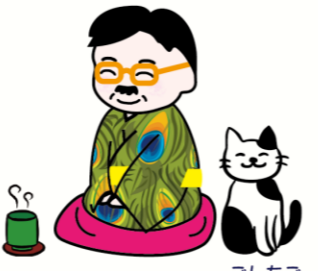
こしちこ 愛猫の五七七