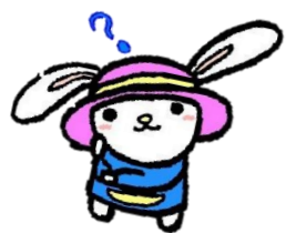
▲ マスコットキャラクター「うさのさん」