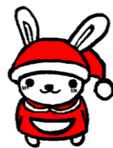
「うさのさん」 サンタ特別バージョン

今年も1年間ぼくのクロスワードにチャレンジしてくれてありがとう。今年は、下はようちえんやほいくえんの子から、上は中学生まで、幅広いさのっこからおうぼがあったのがうれしかったなあ。さあ、今年最後のパズルにちょうせんだ！