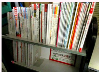
◀ 回収した保存期限切れの雑誌は、リサイクル雑誌として地域の皆さんに供出しています。

毎日やっている仕事に加えて、上記のようなこともおこないます。月末は特にやることが多いので、複数人で分担して作業をしています。