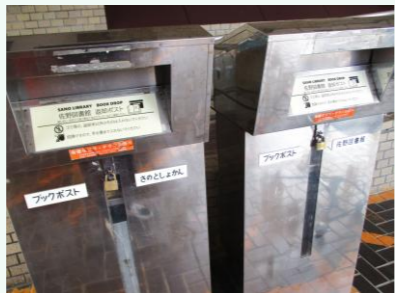
◀ 休館日はブックポストにたくさんの本が返却されます。