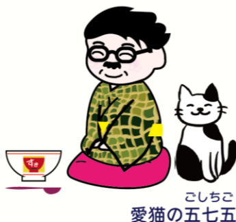
こしちこ 愛猫の五七七

「先生が今年一番はまったものはなにかにゃ？」 「うーん、なんじゃろな。ネット麻雀は打ちまくってあったが別に今年に限ったことではないしな。」 「食べ物とかではないのかにゃ？」 「もうこし輪太郎は食べまくってあったがこれも別に今年に限ったことではないしな。」 「あ、一時期今更ながらすき家の高菜明太マヨ牛丼にはまって週一ペースで食べてあったな。紅しょうがを投入してぐりぐりかきまぜてわき目もふらずにスプーンで一気にかきこむのじゃ。これは余談じゃが、すき家のどんぶりの湾曲面とスプーンの形状のフィット感が絶妙で最後の一粒までご飯を気持ちよくすすめるのがいいのじゃ、とか喋っていると無性に食べたくなってくるな……」 「さっき晩御飯食べたばかりだにゃ。」