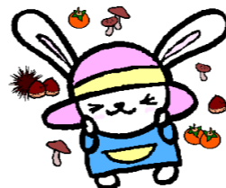
佐野センターマスコットキャラクター「うさのさん」

さのっこのみんな、食欲の秋、つまりぼくのいちばん好きな季節の秋だよ。フルーツにきのこ、おそばにおさかな、好き嫌いせずになんでも食べるほくみたくにみんなもモリモリごはんを食べよう。おいしいものもいいけれど運動もわずれずに！