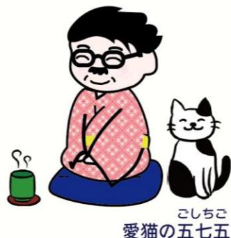
こしちこ 愛猫の五七五

「先生は靈感ってあるのかにゃ？」「ないと言えればこんなに楽なこともないのじゃがな。別に見たいわけでもないのに見えてしまうというのなかなかきついものがあるからな。現に今もほら、わしの机の上に古ぼけた電気スタンドの霊が見えておる。靈感のないキミには分からんかもしれんがあれは二十年くらい前に島忠で買ったものじゃからとっくにこの世のものではなくなっておるはずじゃ。首のネジが折れて角度の調節もできないし、傘の部分はさび付いてちよっと触ると手が汚れる始末。なのに未だ成仏できずにこうして夜な夜なわしの机の上に現れておる。ふびんなことじゃな」 「今度粗大ゴミに出しとくにゃー」