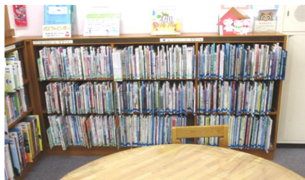
▲ 緑色・青色シールの絵本の棚