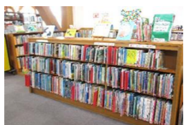
赤色シールの絵本の棚