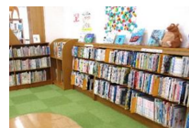
黄色シールの絵本の棚