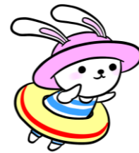
佐野センターマスコットキャラクター「うさのさん」

さのっこのみんなは信じられないかもしれないけど、20年くらい前は、夏でも気温が低くて学校のプールが中止になるのが珍しくなかったんだって。泳ぎがニガテなぼくからするとちょっとラッキーって感じだな。それにしても暑すぎるよね～！