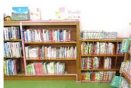
桃色シールの絵本の棚

佐野図書館には魅力的な絵本がたくさん。お子さんだけでなく大人の方も、是非手に取ってみてください！