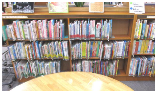
▲ 灰色シールの絵本の棚