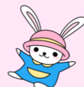
マスコットキャラクター 「うさのさん」