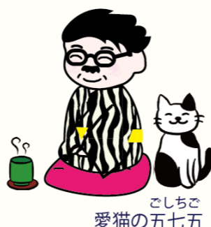
ごしちご 愛猫の五七七

「先生は朝ごはんってちゃんと食べてるのにな」うむ、毎朝空腹で目が覚めるくらいじゃかな。食へろといわれれば「トホーンス」でもホルモン焼きでもなんでも食べるかまえじゃ」「朝からホルモン焼きは遠慮したいにや」「とはいえまあ、基本は菓子パンとコーヒートピタミン剤の定食ですますことが多いがな」「チー」プな定食だにや」「ナイススティックは常備してあるからな。というか中のクリームだけ瓶詰にして売って欲しいくらいにや」「それはちよっとわかるにや」