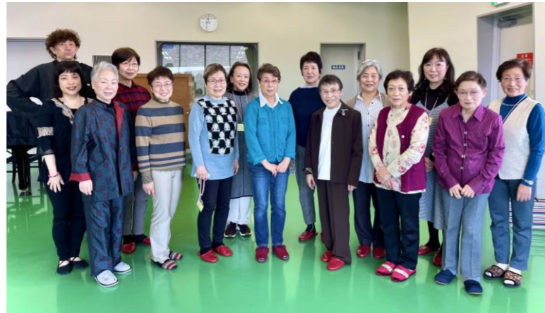
素敵な笑顔で集合写真

活動日時：毎週土曜 午前10時～11時30分 月会費：3,500円 入会金：なし 連絡先：連絡希望の方は佐野センターまで (03-3628-3273) 対象：16歳以上の女性