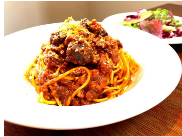
おすすめの「お肉ゴロゴロポロネーゼ」1,900円