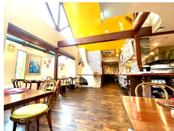
解放感あふれる店内にはたっぷり 20 席あります。