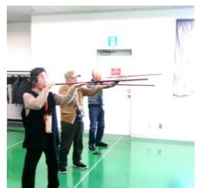
1月に開催された大会の様子

年度末が近づくと交流大会の時期。さらなる技術向上を目指してミニ大会が開かれます。まずは一度、吹き矢講座に来てみませんか。ハマるかもしれませんよ?