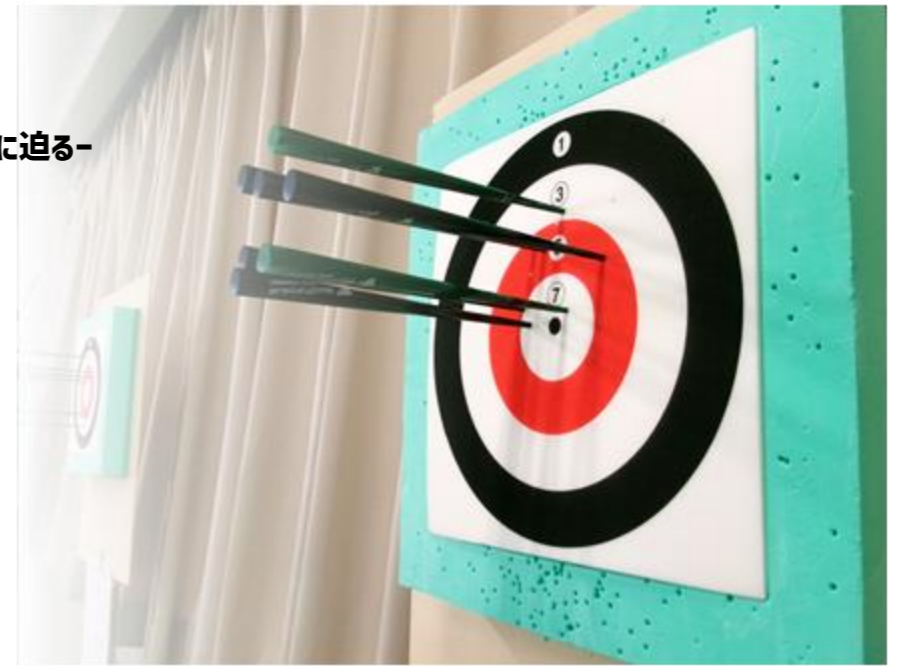
スポーツウェルネス吹き矢 毎月第1・3(木) 午後3時30分～5時 (詳細は4ページ)