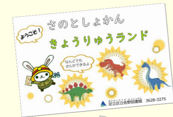
恐竜発見カードの みほん