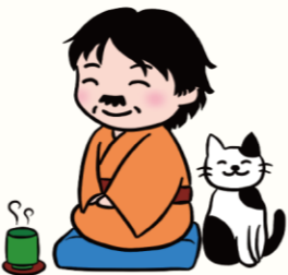
ごしちご 愛猫の五七五