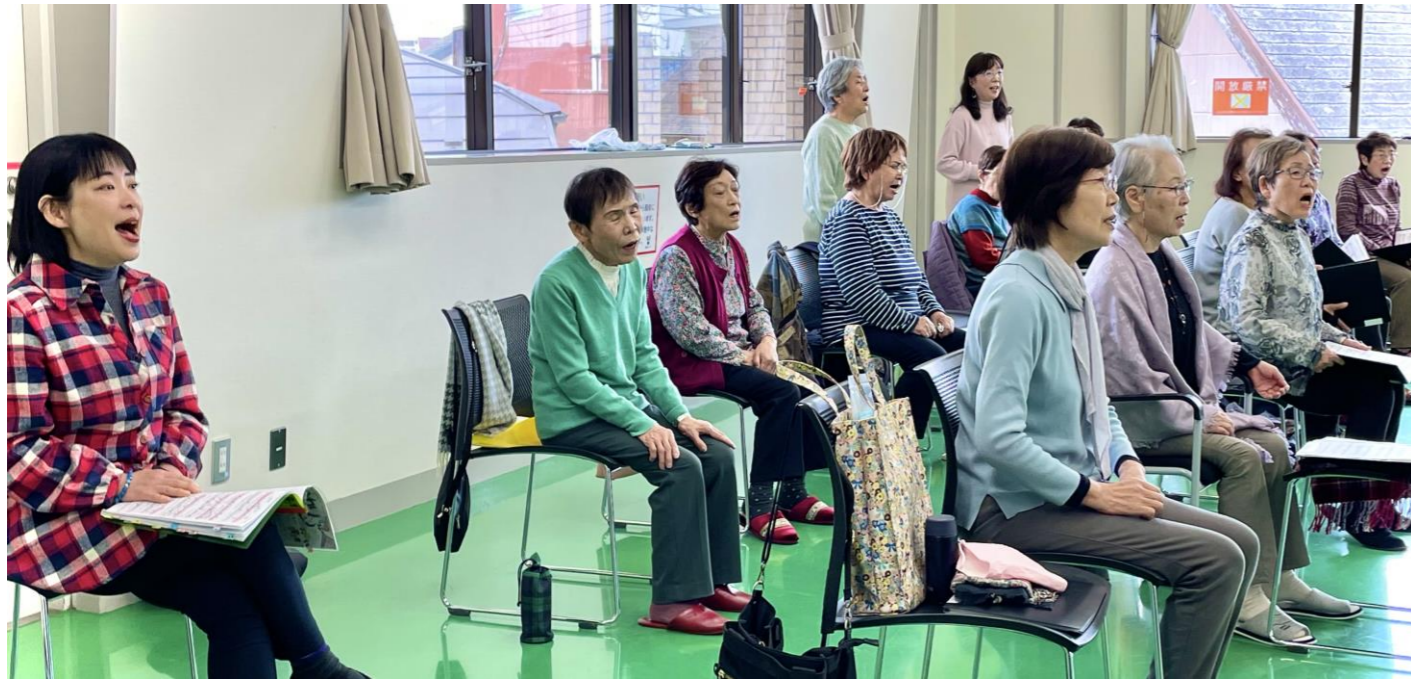
練習中の風景。のびのびとした美しい歌声に脱帽です。