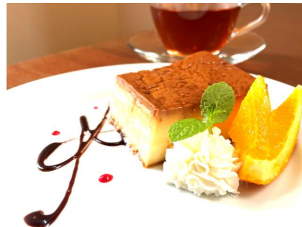
「クラシックプリン」600円