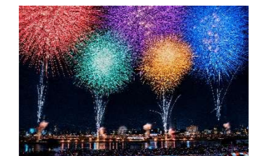
足立区街フォトコンテスト応募作品 第4回/あお氏

【日時】5月30日(土) 午後7時20分~8時20分 ※荒天の場合は中止(順延なし) 【会場】荒川河川敷 (東京メトロ千代田線鉄橋~西新井橋間) 打ち上げ場所は千住側