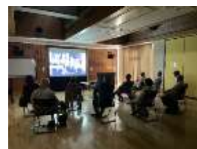
ほっかシネマひろば