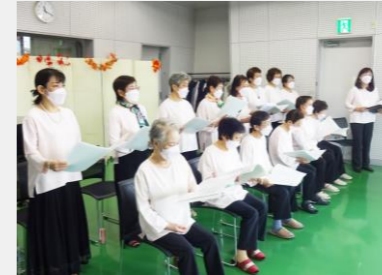
「コーラス“桜”」の合唱体験・発表

秋の風物詩としてサークルや地域の方々が楽しみにされて いたふれあいまつりですが、今年度はサークル体験・発 表会として 10 月 16 日におこなわれました。当日は晴天に 恵まれ、それぞれのサークル会員のご家族ご友人など多く の方にご来場いただきました。このイベントをきっかけに サークルに入会された方もちらほら。ウィズコロナにおけ