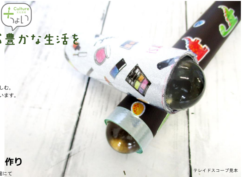
テレイドスコープ見本