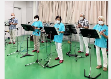
「佐野ハワイアンズ」のウクレレ発表