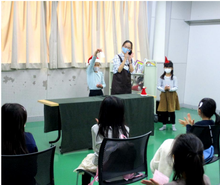
これまでも小さな魔法使いが何人も誕生しました。キミにもなれる魔法使い!