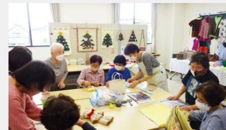
「手芸倶楽部」のタオルペーパー作り体験