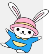
佐野センターマスコットキャラクター 「うさのさん」

るイベントということもあり、来場者数は例年より控えめ だったかもしれません。しかし、かつてのおまつりのよう な賑わいが佐野センターに戻ってきたようで活気あふれる 一日となったことをまずは喜びたいと思います。また来年 度以降はふれあいまつりとしてより多くのサークルの皆さ まとともに開催できることを願ってやみません。