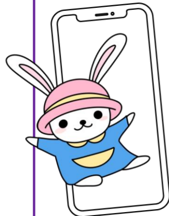
佐野センターマスコットキャラクター「うさのさん」