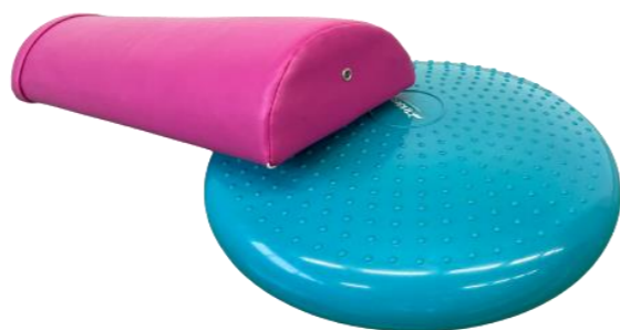
ストレッチボール バランスクッション